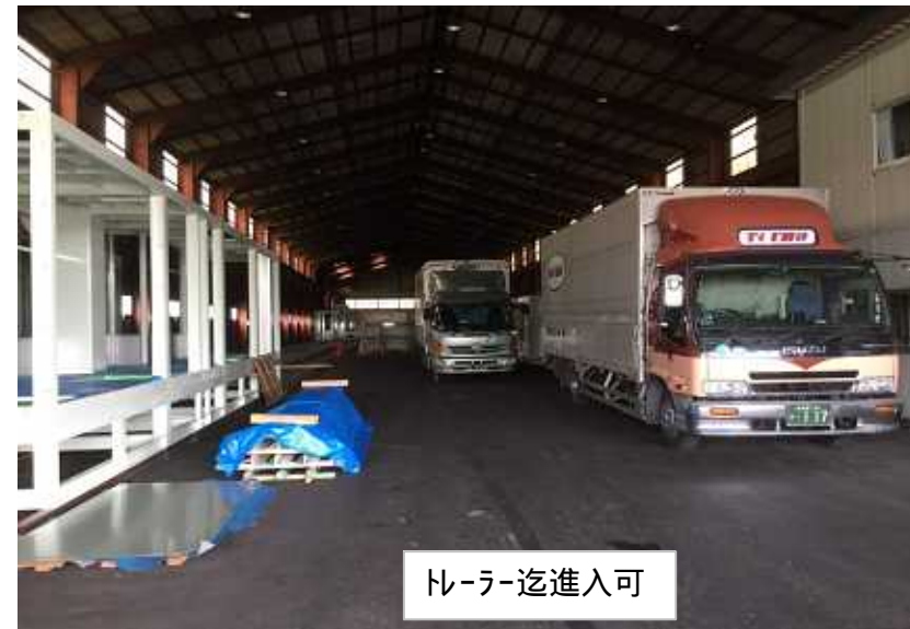
トレーラー-迄進入可