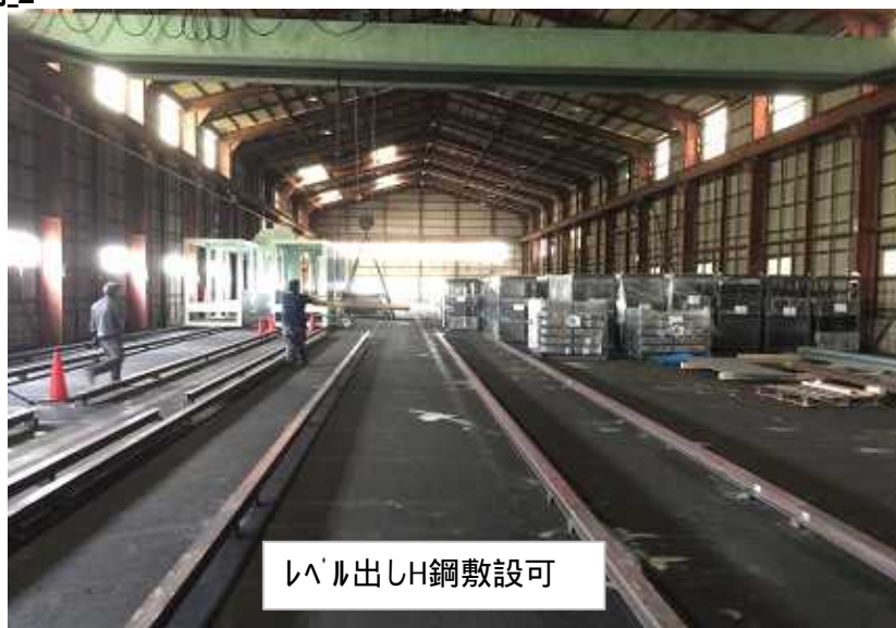
レベル出しH鋼敷設可