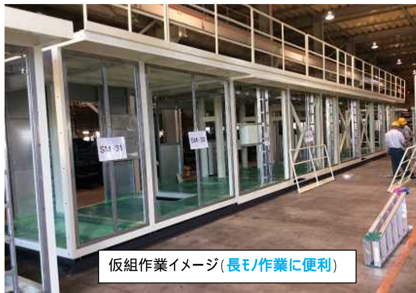
仮組作業イメージ(長モノ作業に便利)