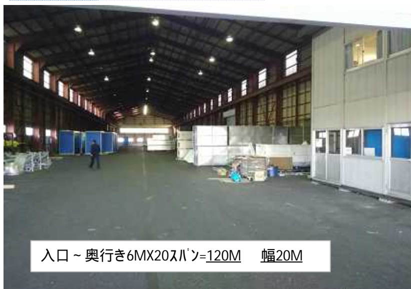
入口～奥行き6MX20スパン=120M 幅20M